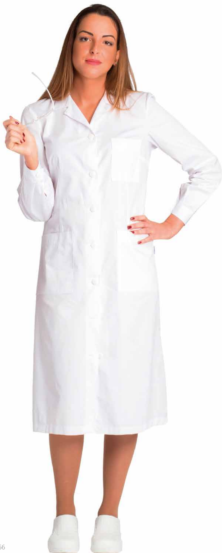
CMD402 Camice Donna 100% Cotone Taglie: 40-42-44-46-48-50-52-54-56 Colore: Bianco